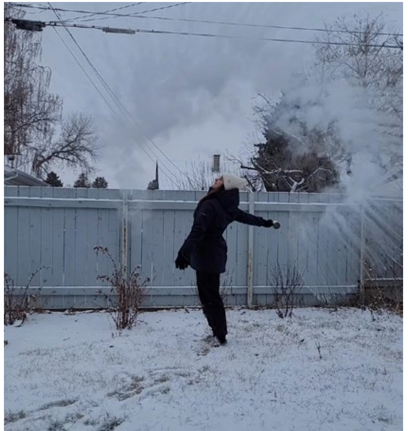
▲ Dorothea in der Kälte

In letzter Zeit und vor allem in der letzten Woche, durfte ich wieder erkennen, wie wichtig es ist ruhig vor Gott zu werden und zu hören, was er zu sagen hat. Gebet ist ein Gespräch, kein Monolog! Gott hört alles, was du ihm erzählst, und er sieht alles, aber wir müssen auch auf ihn hören. Mir fiel es in den letzten Wochen schwer, mir diese Zeit zu nehmen und einfach in seiner Gegenwart zu sitzen. Meine Gedanken sind immer abgeschweift und hingen in all dem, was ich noch tun muss. Meine Beziehung hat sich sehr einseitig angefühlt, weil ich mir nicht die Zeit genommen habe, innezuhalten. Zeit nehmen und versuchen