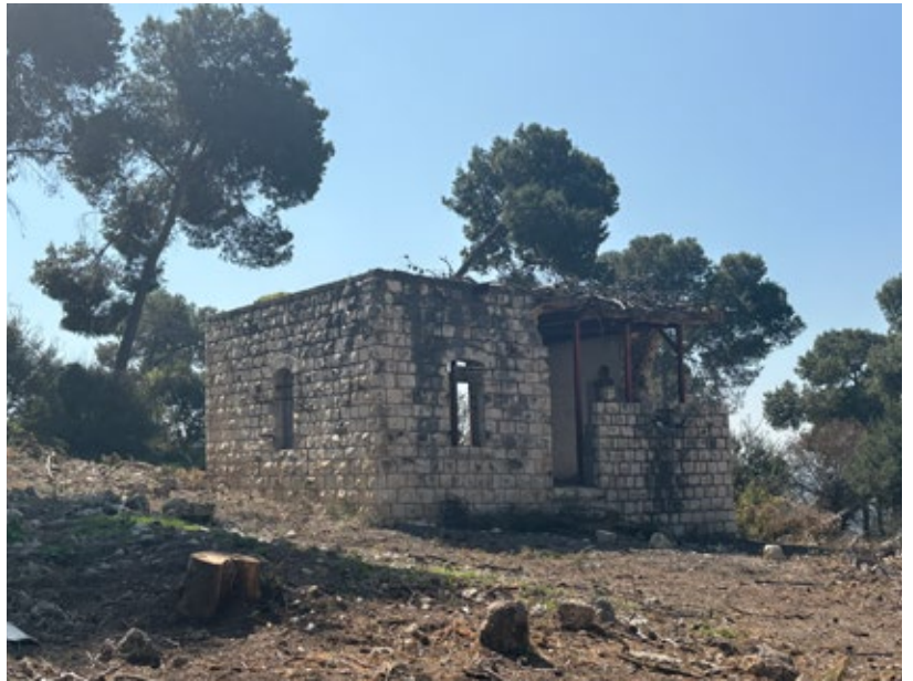
▲ Die Ruinen der Moschee von Maloul

Damit ist Zochrot eine der insgesamt circa 20 israelischen Nicht-regierungsorganisationen, die sich heute für Versöhnung, Frieden und