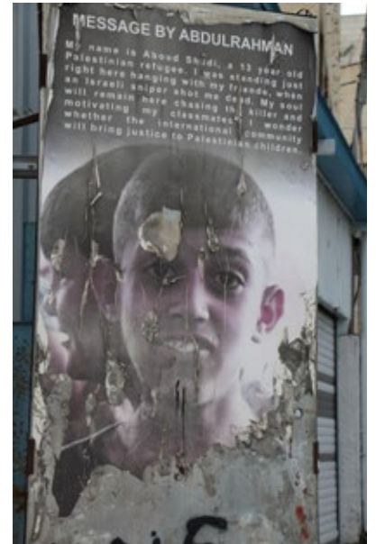
▲ Gedenken an einen ermordeten Jugendlichen, direkt vor dem Jugendzentrum

Lajee bedeutet auf Arabisch „Flüchtling“. Gegründet im Jahr 2000 von jungen Menschen aus dem Camp, hat sich das Zentrum zu einem kulturellen und kreativen Zufluchtsort für palästinensische Jugendliche entwickelt. Hier können sie tanzen, musizieren und sich künstlerisch ausdrücken. Kurse für den traditionellen palästinensischen Tanz „Dabke“, Musikurse und Kochworkshops geben ihnen eine