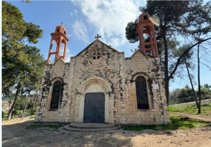
▲ Die Kirche von Maloul. Ein Gottesdienst im Jahr ist erlaubt