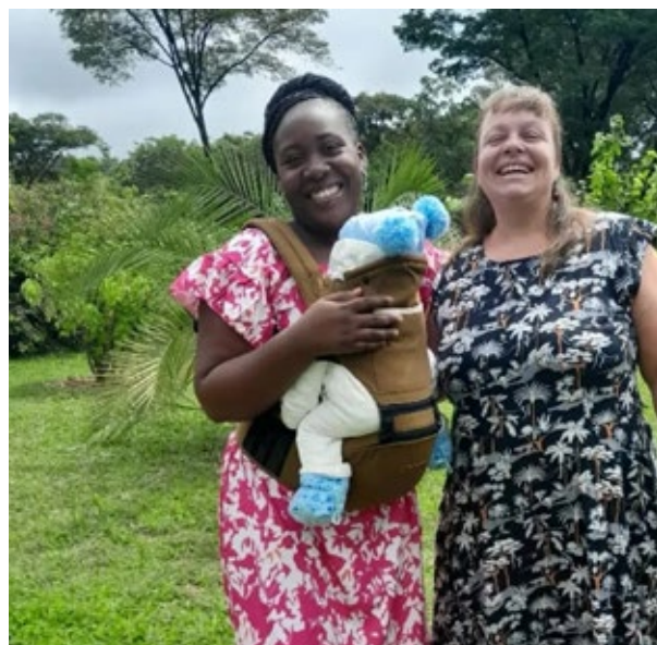
▲ Freundschaften entstehen

Das ist eigentlich das Jahr, wo wir wieder zurück nach Deutschland wollten. Stattdessen hat uns Gott frisch gesagt, dass er uns länger hier haben möchte. Wir dürfen zum ersten Mal die Freiwilligen die nach Sambia kommen begleiten. 11 leidenschaftliche Junge Erwachsene, die selbst sehr motiviert mit viel Abenteuerlust und einem Herz