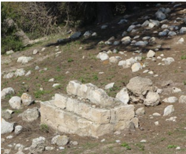
▼ Ein Grab auf dem zerstörten Friedhof von Maloul