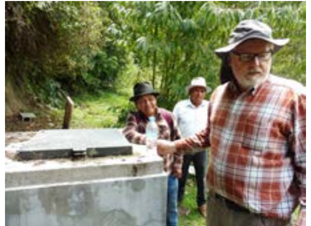
▲ Quellwasser Fassungsbälter für die Druckleitung in das Dorf Asama im Norden von Quito

Wir konnten in Shell, im Urwald gelegen miterleben, wie für das Missionskrankenhaus neues Personal eingestellt wurde. Es stand schon kurz vor der Schließung, aber durch neu gewonnenes internationales Personal kann es weitergeführt werden. Im Ort gibt es eine Flugschule mit Flughafen für kleine Flugzeuge, was für die Gegend sehr wichtig ist, um Hilfsgüter oder Kranke zu transportieren. Von Shell aus sind wir zusammen mit Verantwortlichen