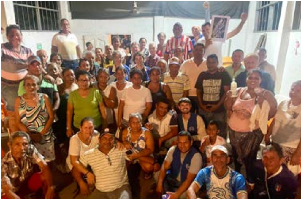
▲ Guayabo Community

legation bereits hastig das Frühstück zu – wir dürfen unsere Chalupa, das Schnellboot, das uns über den Magdalena Fluss zum Pueblo El Guayabo bringen wird, nicht verpassen.