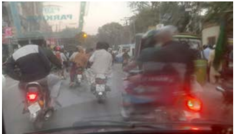
▲ Belebte Straßen in Pakistan

Die Pläne für meinen Dienst in Pakistan: Einige Bekannte helfen mir, meine Finanz-Arbeit bei den Christlichen Schulen in Lahore (12 Millionen