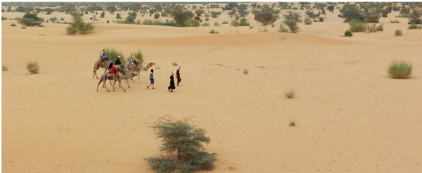
▲ Studienreise mit Wüstenaus- flug